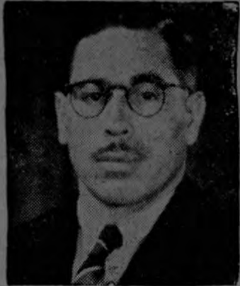
Prof. don Isaac Felipe Azofeifa

La ciudad de Heredia viene enfocando desde hace algunos meses, el problema de la Facultad de Pedagogía, con motivo de que la Universidad desea tener a todas sus Facultades en la ciudad de San José para mayor ventaja de todos sus estudiantes, y los heredanos se oponen a su traslado. Por tal motivo, entrevistamos al profesor don Isaac Felipe Azofeifa, actual Director General de Educación Secundaria.