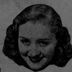
Virginia Dale Paramount Red

DE VENTA EN TODAS LAS BOTICAS Y DROGUERIAS