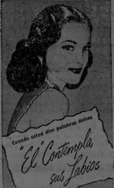
Quando usted dice palabras dulces "El Contempla sus Labios"

—¿Y con qué se vestían, entonces, Adán y Eva en el invierno?